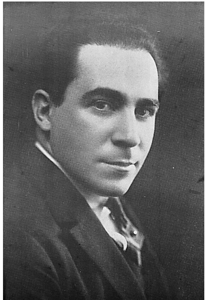
Oscar Lorenzo Fernández

Besonders feurig wird es im Tanz Batuque des brasilianischen Komponisten Oscar Lorenzo Fernández. Ursprünglich stammt Batuque aus einer dreiteiligen Suite aus Stücken seiner Oper Malazarte (1933). Mit seinem eingängigen Rhythmus und dem energiegeladenen Motiv avancierte Batuque zu einem der bekanntesten Werke von Fernández. Der Brasilianer gilt als einflussreicher Komponist und Dirigent seines Heimatlandes und komponierte ein Ballett, zwei Sinfonien und diverse andere Werke für Orchester, Ensemble und Gesang.